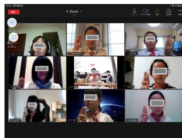
ブラウニー部門のオンライン集會の様子

今、4団は新しい歩みを始めています。9月からは本格的に教会での集会を再開しています。「三密」にはスカウト自ら率先して注意してくれています。いつでも、オンライン集會に切り替えられる様「そなえて」います。スカウトクラブの皆様、これからのスカウト活動を今まで以上に応援してください。見守ってください。宜しくお願ひします。因みに今年度の活動テーマは「どんな時でも私はスカウト」です。