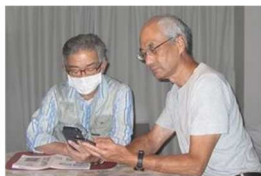
スマホ版 ZOOM の対面レクチャー

各種設定、通信法に関しては少し経験のある人が「お助け隊」となり下記マニュアルを用いて対応しました。当方に依る対面レクチャーも行い参加可能としました。