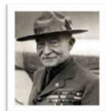
バーデン・パウエル卿の言葉

私の山は“もっと広く見なさい、もっと高く見なさい、もっと先を見なさい、そうすれば道が見いだせる”と私に言いかけせる