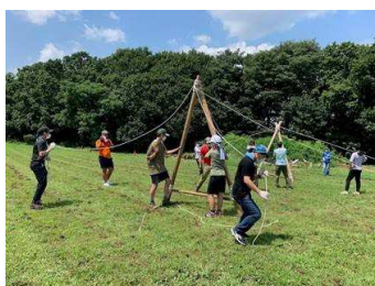
8月夏季日帰りキャンプ(ヒヨドリ野営場)

集会で「3密」に注意しながら、「口からの飛沫防止」を徹底させています。また、スカウト達は若く、抵抗力もあり、感染しても軽症です。年齢も高く、感染後、重症化する可能性が有ります。このことも、十分に考慮し、感染せず、感染元にならないように細心の注意を払い、この難しい環境下で活動を進めて行きたいと考えています。皆様のご協力を期待しています。